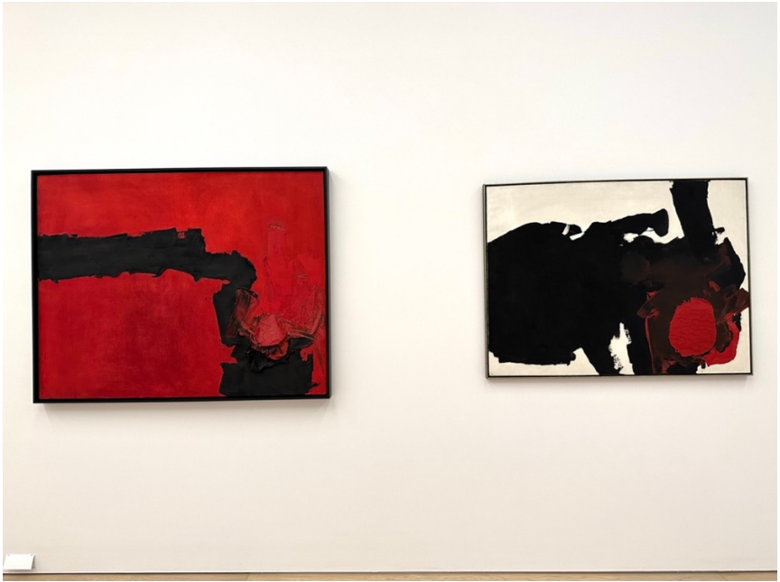
Luis Feito (Madrid, España, 1929 - 2021)

Luis Feito comenzó su formación académica en la Escuela Superior de Bellas Artes de San Fernando (ahora Real Academia de Bellas Artes de San Fernando), Madrid, en 1950. Trabajó brevemente en un estilo figurativo antes de descubrir el cubismo, pero en 1954, presentó su primera exposición individual de obras no figurativas. A partir de entonces, Feito siguió comprometido con la pintura en un modo abstracto.