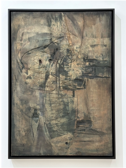
Lucio Muñoz (Madrid, España, 1929 – 1998)

Lucio Muñoz pertenece a la generación de artistas españoles de los años cincuenta y es considerado uno de los pioneros de la abstracción en el país. El artista trabaja en sus comienzos el paisaje, género muy practicado en dicha época en España, especialmente entre los que se consideran discípulos de Benjamín Palencia. En 1955 se exponen los primeros cuadros de Muñoz cercanos a la abstracción, influenciados por Paul Klee, Rufino Tamayo, Ben Nicholson y Joaquín Torres García, entre otros.