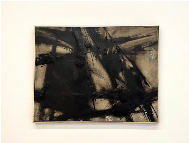
Joan Hernández Pijuan (Barcelona, España, 1931 – 2005)

En cuanto al grupo Sílex, se forma a finales de 1955 con algunos antiguos miembros Inter Nos (Alcoy y Hernández Pijuan) y los pintores Planell, Rovira Brull, y Ll. Terricabras. No contó con una estética determinada ni lanzaron proposiciones teóricas, simplemente insistían en la conexión del arte contemporáneo con el primitivo y en algún momento comenzaron a insistir en el expresionismo y la abstracción. El grupo hizo bastantes exposiciones y estableció conexiones, aunque hasta 1957 no expuso en Barcelona. “La política artística del franquismo: el hito de la Bienal Hispano-Americana: el arte español de postguerra” , Miguel Cabañas Bravo (extracto)