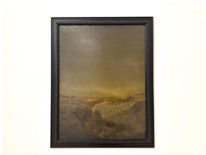
Gustavo Torner (Cuenca, España, 1925)

Pese al hincapié que se hace en la importancia de la creación de grupos de artistas como parte del desarrollo del arte español en la estética informalista, no se pueden pasar por alto las valiosas aportaciones de Luís Gordillo, Francisco Ferreras, Lucio Muñoz, César Manrique y Esteban Vicente, quienes han sido igualmente influyentes a pesar de trabajar de manera independiente.